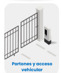
Portones y acceso vehicular